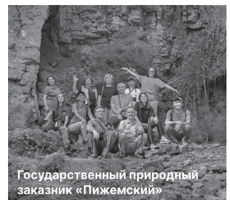
Государственный природный заказник «Пижемский»

В ходе научной конференции и круглого стола научные сотрудники, эксперты обменялись разработками и методами