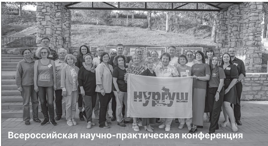
Всероссийская научно-практическая конференция

Бюллетень издается заповедником «Большая Кокшага» для жителей поселков и деревень Медведевского и Килемарского районов: Краснооктябрьский, Старожильск, Шапы, Пижма, Юж-Толешево, Аргамач, Орловка, Соловыи, Нужъялы, Кучки, Азяково, Кужинский Конопляник, Кужолок, Красный Мост, Шантунга, Шушер, Кундыш, Озерный, Широкундыш, Актаюж, Трехречье.