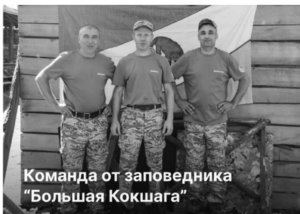
Команда от заповедника «Большая Кокшага»

Такие мероприятия проводятся с целью повышения уровня физической подготовки инспекторского состава, обмена опытом, пропаганды здорового образа жизни и совершенствования профессионального мастерства сотрудников службы охраны окружающей среды.