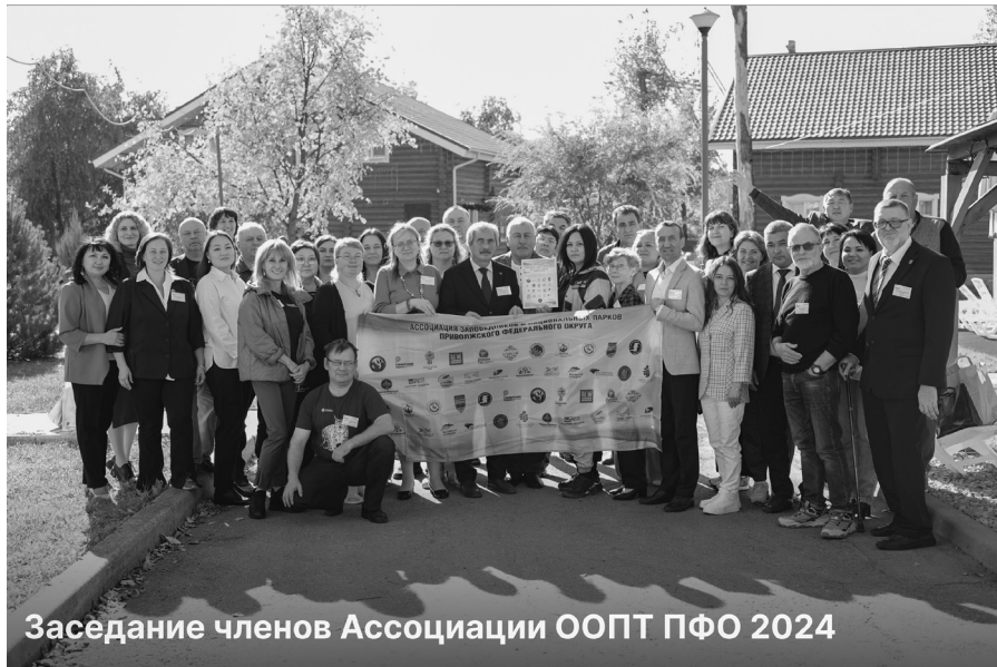
Заседание членов Ассоциации ООПТ ПФО 2024

Сотрудники заповедника «Большая Кокшага» приняли участие в Восьмом окружном форуме «Студтуризм-2024».