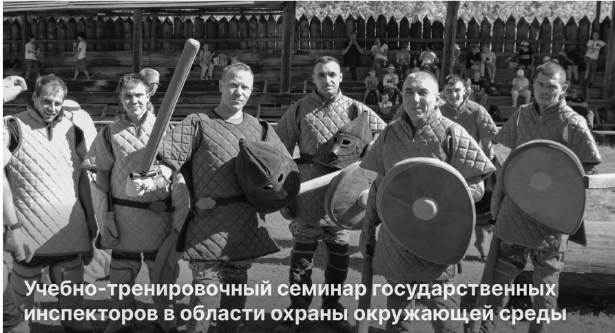
Учебно-тренировочный семинар государственных инспекторов в области охраны окружающей среды