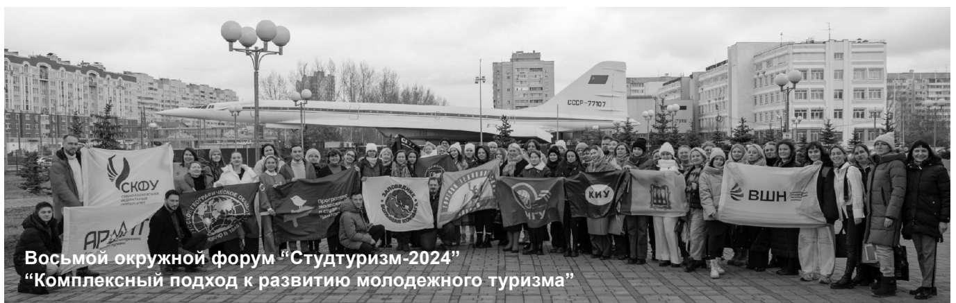
Восьмой окружной форум «Студтуризм-2024» «Комплексный подход к развитию молодежного туризма»