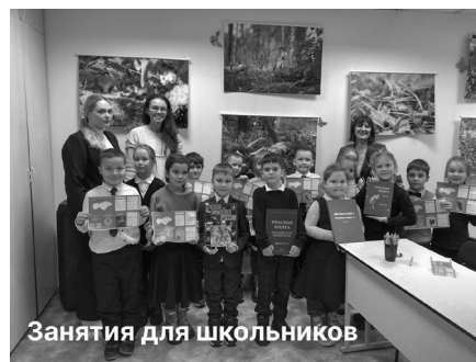
Занятия для школьников

Визит центре «Комино» проходят занятия для школьников. Внеклассные уроки позволяют сформировать интерес ребят к экологии родного края, знакомят с флорой и фауной особо охраняемых природных территорий Республики Марий Эл.