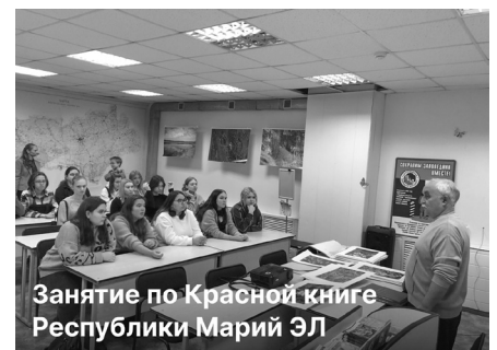
Занятие по Красной книге Республики Марий Эл

Мастера садово-паркового и ландшафтного строительства, лесного и лесопаркового хозяйства, садово-паркового и ландшафтного строительства могут пройти практику на территории оопт.