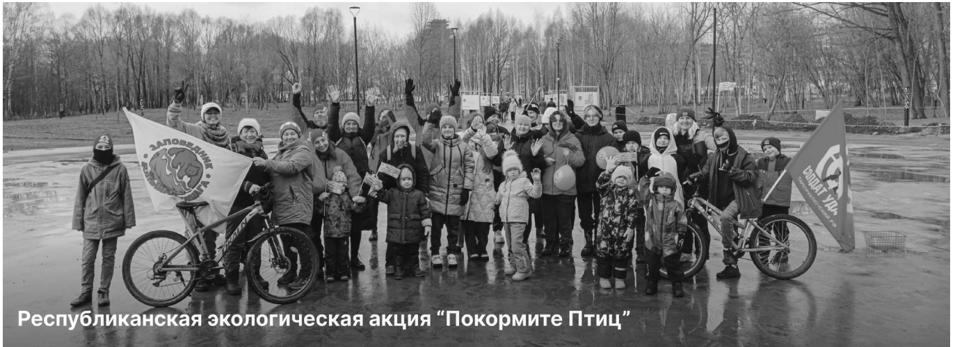
Республиканская экологическая акция “Покормите Птиц”

10 ноября 2024 года в Йошкар-Оле состоялся первый этап Республиканской экологической акции “Покормите птиц”.