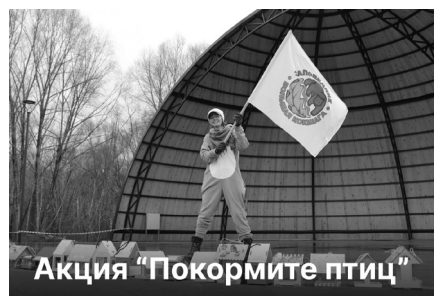
Акция “Покормите птиц”

Мы надеемся, что такой формат мероприятий пришелся по душе жителям города Йошкар-Олы.